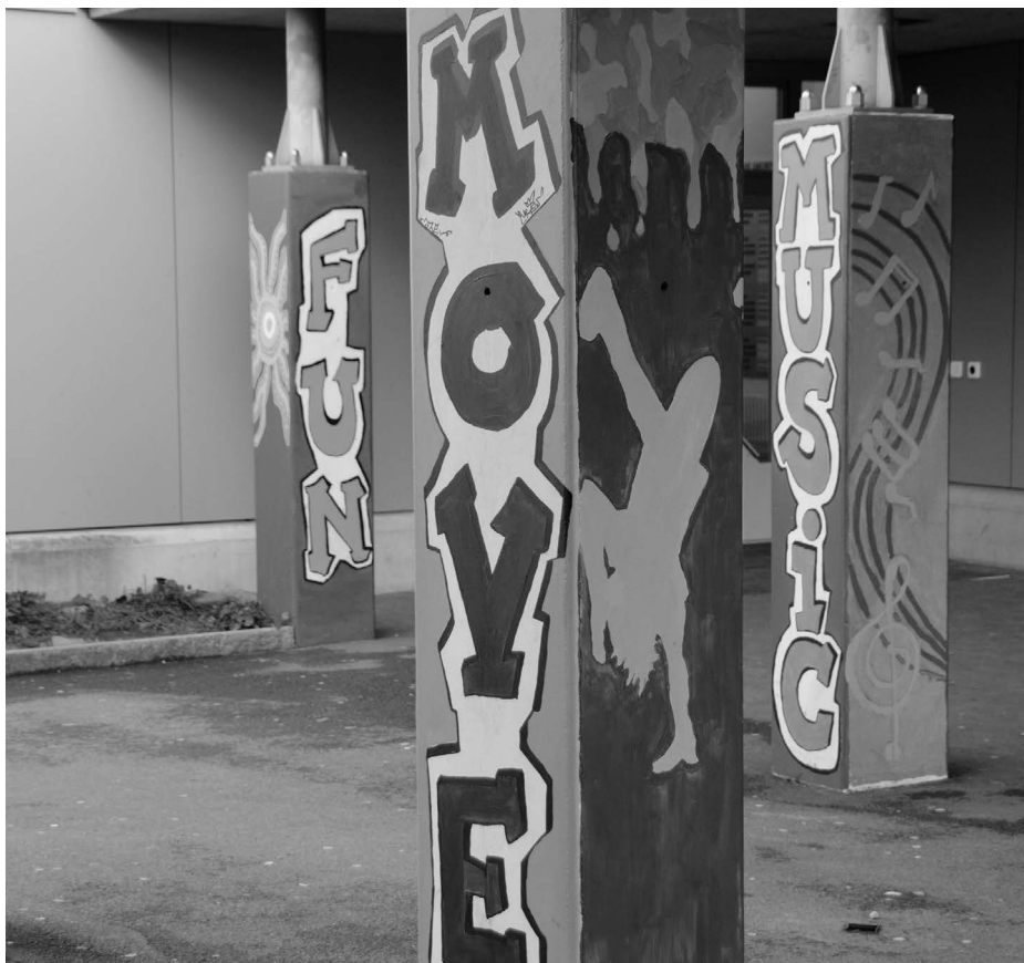
Neu gestaltete Säulen

Die Wahlfachklasse 2014/2015 hat sich dann liebenswürdigerweise dazu bereit erklärt, das Säulenprojekt weiterzuführen und mit passenden Motiven, Silhouetten und Mustern zu vollenden. Oft musste nochmals eine Farbschicht zur Farbsteigerung aufgetragen werden und das Ausbessern der verschiedenen Motive erforderte viel Geduld, genaues Arbeiten und Durchhaltewillen. Die Säulen sind grossartig geworden. Ein grosses Kompliment gehört allen Mitwirkenden!