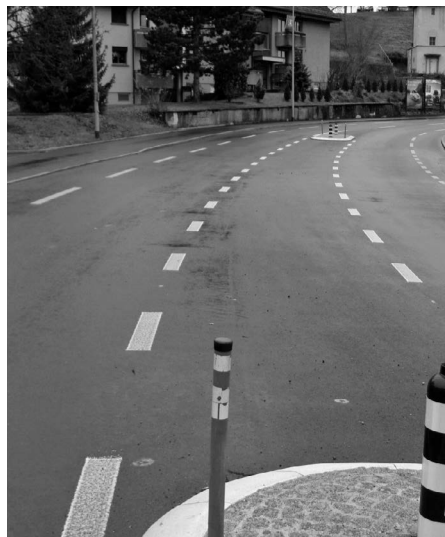
Mehrzweckstreifen in Feuerthalen