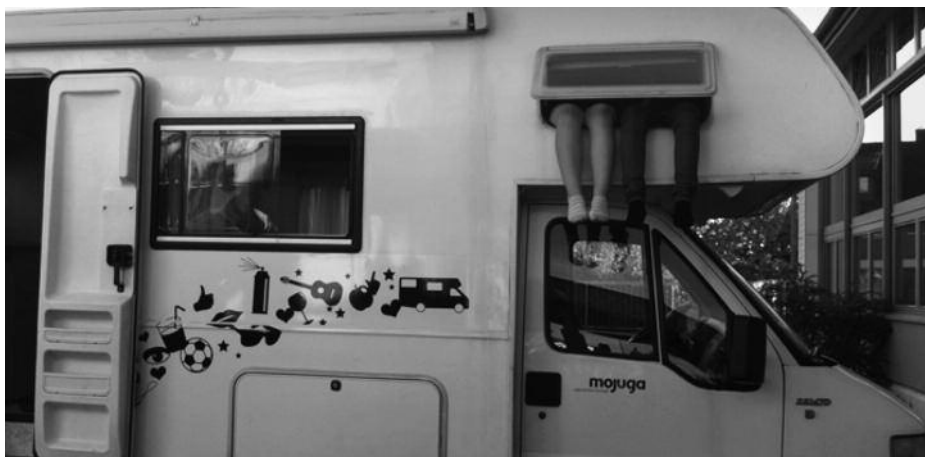
Einfach mal abhängen im mobilen Treffpunkt