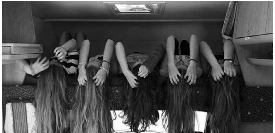
Haargenau! Die Mojuga kümmert sich um Jugendliche