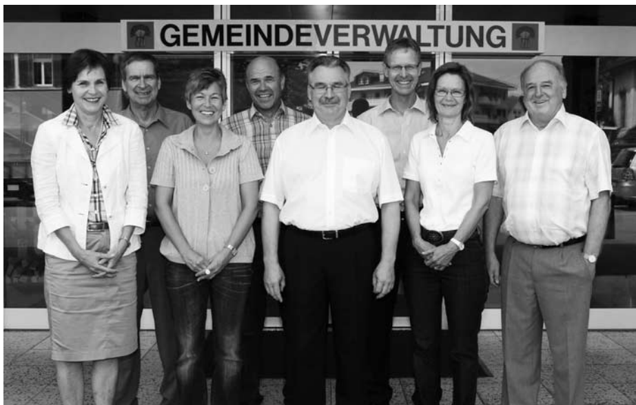
Ihr Gemeinderat (mit Gemeindeschreiber)