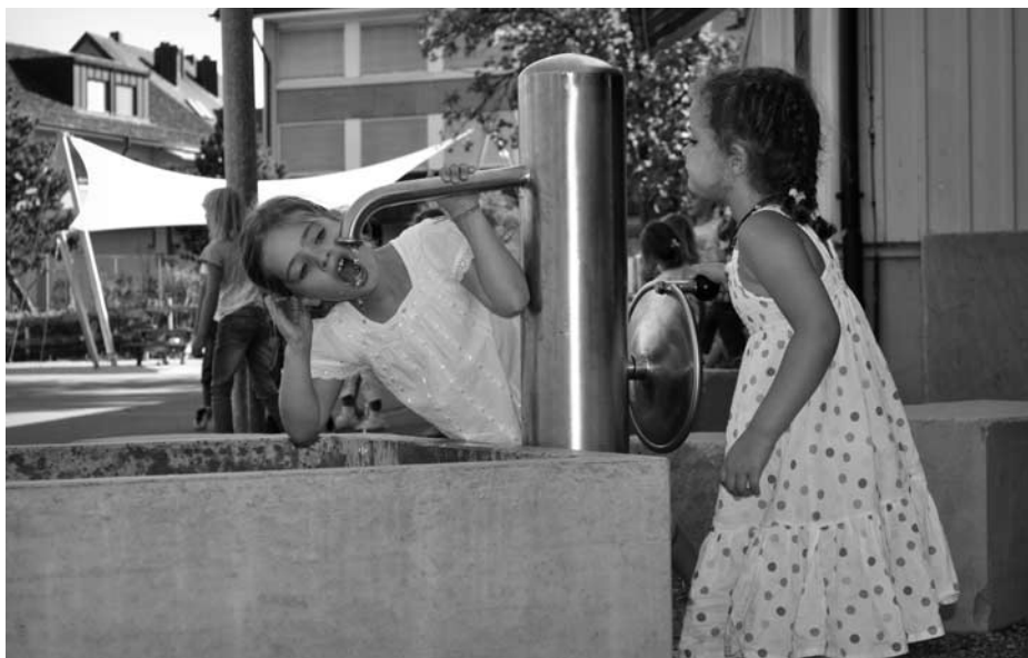
Brunnen mit Handpumpe

Während mehrerer Monate wurde gebaut, gemalt und gepflanzt: Jetzt erstrahlt der Pausenplatz des Schulhauses Altes Dörfli in neuem Glanz und bietet auf relativ begrenztem Raum eine erstaunliche Vielfalt an Spielmöglichkeiten.