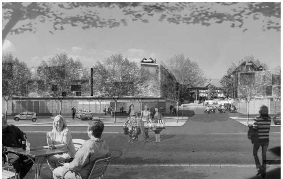
Vision Blickrichtung Zentrum: ADP Architekten, Zürich