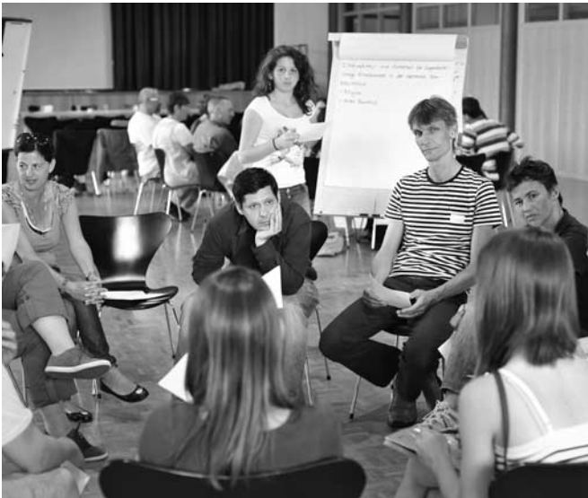
Dialog im Stuhlkreis

Zusammen den Dialog suchen – dies haben sich fast hundert Jugendliche und Erwachsene als Ziel gesetzt und ein erstes erfolgversprechendes Zeichen gesetzt.