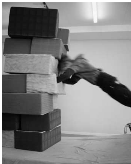
Bewegtes Lernen

Die Begabtenförderung umfasst Angebote für Schüler und Schülerinnen der