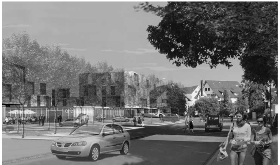
Vision Rütistrasse: ADP Architekten, Zürich