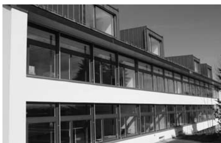
Fassade Süd mit neuen Dachlukarnen