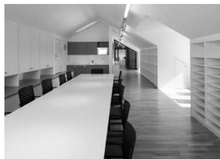
Neues Lehrerzimmer im Dachstock