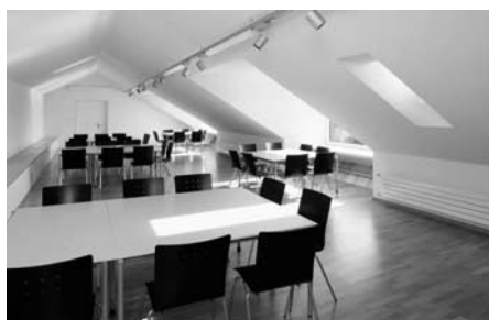
Neuer Mehrzweckraum im Dachstock