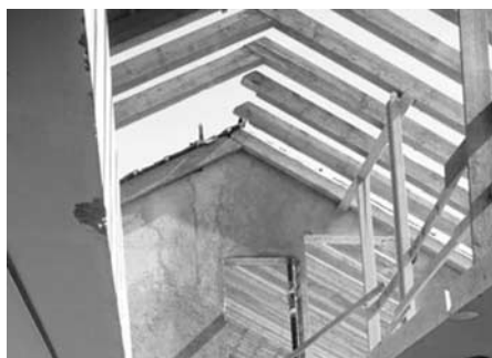
Dachstock während Umbau