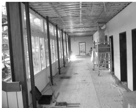
Korridor im Umbau